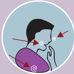
NÁUSEAS/VÓMITO O' PERDIDA DE SABOR/OLFATO