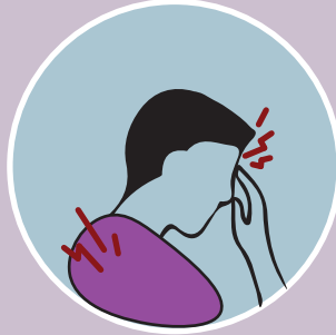
DOLOR DE CABEZA O' MUSCULAR